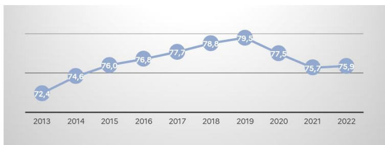
Proportion des eaux de baignade d'excellente qualité